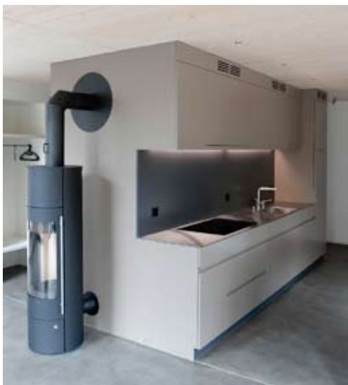
Diese Küche wurde in Einzelanfertigung nach Kundenwunsch angefertigt. Küche Design ??? Bild ??