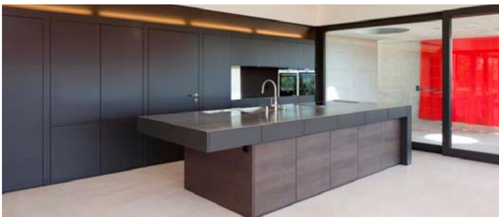
Die Möbel (Küchen, Schränke, Tische, Betten) werden speziell nach den Wünschen und Bedürfnissen der anspruchsvollen Kunden angefertigt. Design R. Giuliani, MGH Arch. Bild SD?